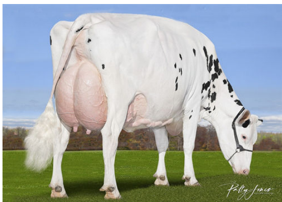
CALBRETT KINGBOY MIRANDA P THIRD DAM